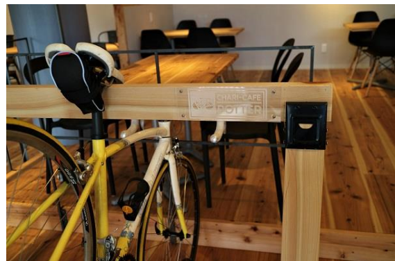
店内のサイクルラック